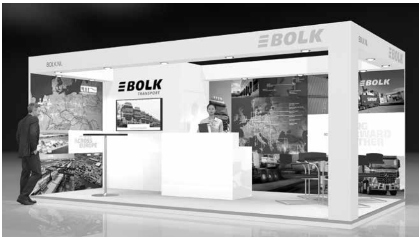
AANZICHT VAN ONZE BEURS IN BREMEN

De tweede fase van de verbreding van de A1 naar twee keer drie rijstroken, van Rijssen tot Azelo/Buren, zal direct aansluitend op de eerste fase (Deventer-Rijssen) plaatsvinden. Ook wordt letterlijk en figuurlijk vaart gezet achter de verbreding en de verdieping van de Twentekanal. Er is langdurig lobby gevoerd voor verbetering van de verbindingen met de Randstad, met name Amsterdam (Schiphol) en Rotterdam (Wereldhaven). Goede verbindingen voor het personen- en goederenverkeer zijn van eminent sociaal-economisch belang, ook met het oog op Twente als logistieke hotspot. Op uitnodiging van Bolk Transport en Port of Twente was minister Cora van Nieuwenhuizen van Infrastructuur en Waterstaat op bezoek en ze toonde zich onder de indruk van het ambitieniveau, de bouwwoede en de ontwikkeling van de logistieke hotspot Twente.