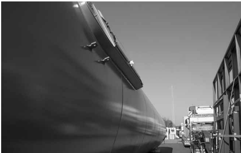
PERSPECTIEF OP DE PLAS