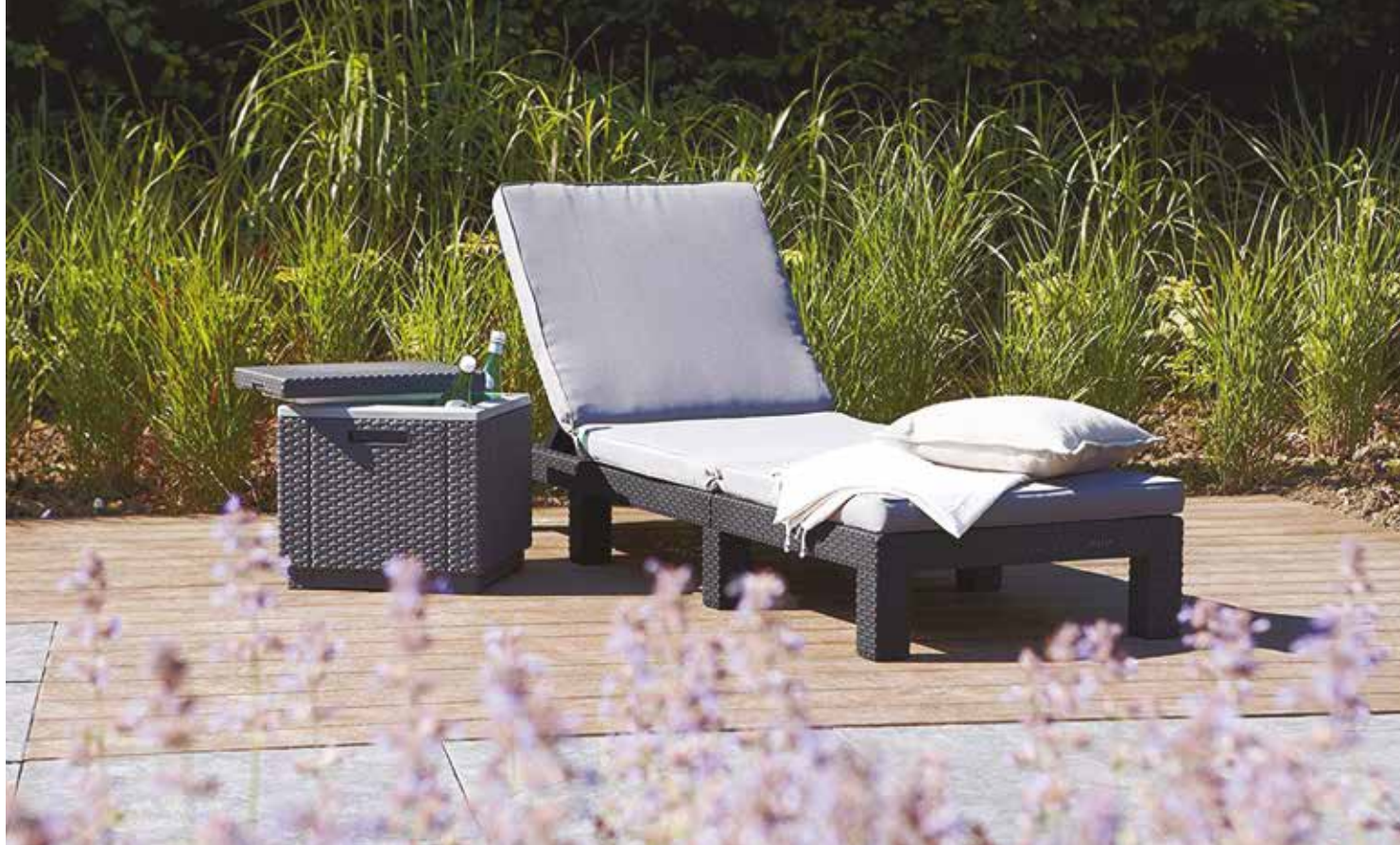
DE JAIPUR LIGBANK GEMAAKT VAN WICKER (GEVLOCHTEN KUNSTSTOF)