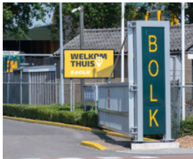
POSITIEVE BOODSCHAP IN NIEUW JASJE