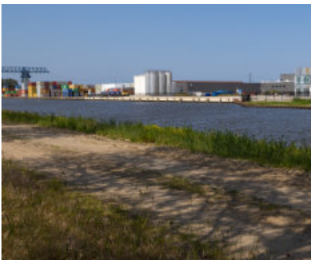
NIEUWE OPENBARE KADE IN ALMELO GEOPEND

Goede reis. Wees zichtbaar in het verkeer. Neem geen risico. Zomaar wat voorbeelden van de positieve boodschap die Bolk al jarenlang uitstraalt met geelgekleurde informatieborden bij de in- en uitgang van het terrein van de hoofdvestiging in Almelo. Borden waarmee we de lezer iedere dag opnieuw attenderen op het grote belang van veiligheid in het verkeer. Deze borden boven de heg zijn door weersinvloeden aan vervanging toe. Dit betekent een nieuw jasje voor een boodschap die onveranderd blijft: 'Neem geen risico en een goede reis'. Daarnaast heten we op deze manier onze medewerkers en bezoekers altijd weer 'welkom thuis'.