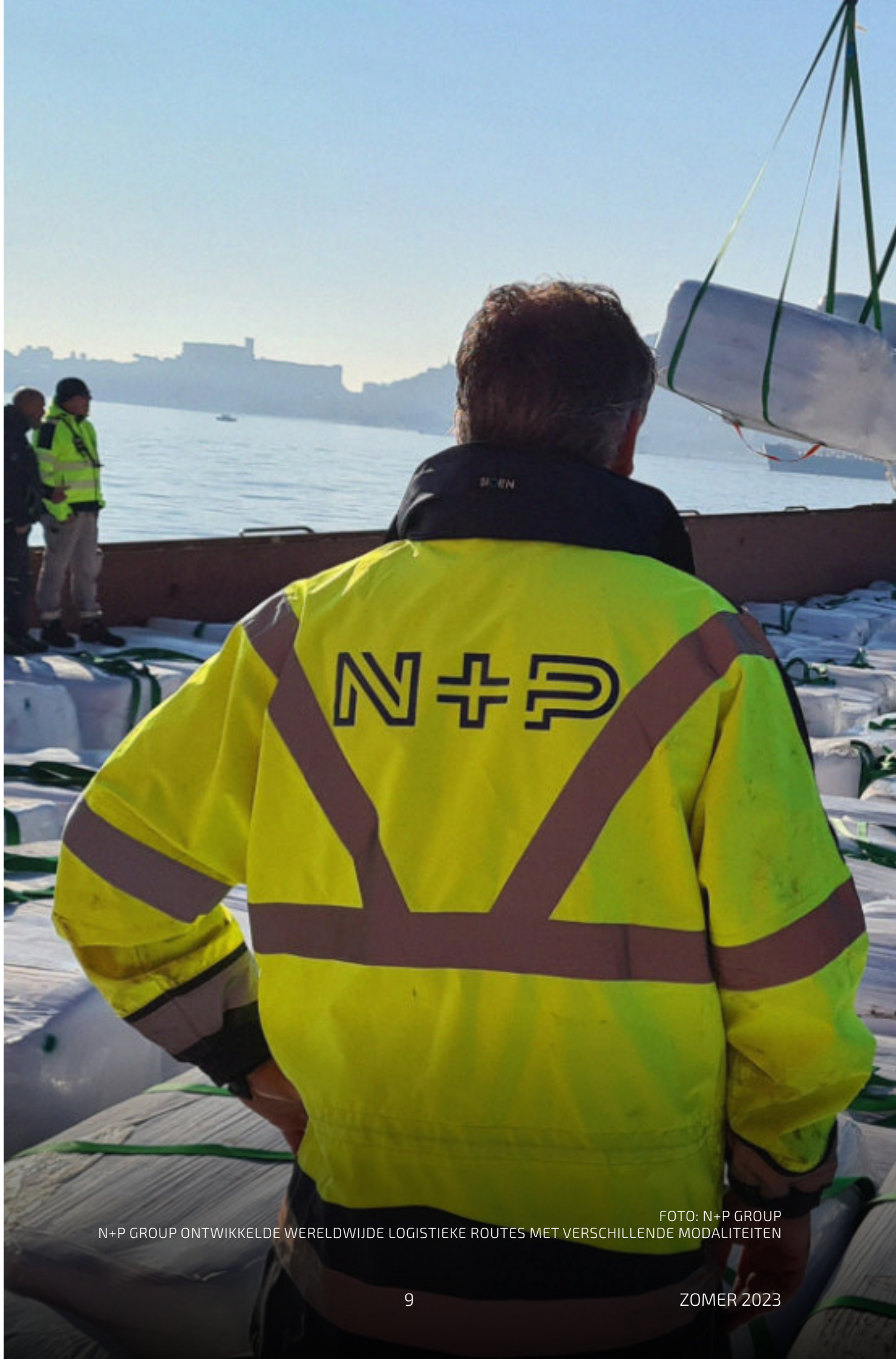
N+P GROUP ONTWIKKELDE WERELDWIJDE LOGISTIEKE ROUTES MET VERSCHILLENDE MODALITEITEN