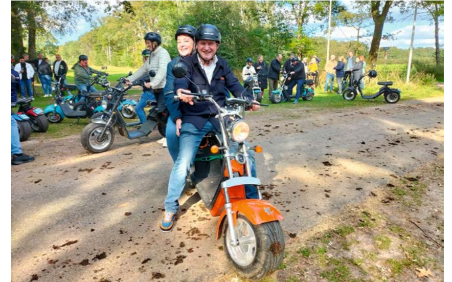
OP DE E-CHOPPER DE NATUUR IN!

Op een schitterende, zonnige zaterdag in oktober kwamen maar liefst 80 deelnemers samen voor de activiteiten die de PV organiseerde bij café-restaurant de Molenberg in Reutum. Na een warm welkom met koffie, thee en krentenwegge gingen de deelnemers in vier groepen uiteen. Al snel vloog van alles door de lucht tijdens het kloot-, vogel- en boogschieten. Ook een verfrissend ritje op een E-chopper stond op het programma. De route leidde door het prachtige natuurgebied Springendal en andere mooie plekken rondom Vasse, Ootmarsum en Reutum. Een lange middag in de frisse lucht maakte hongerig. Dit werd vanzelfsprekend verholpen met een uitgebreid warm en koud buffet. Met passende liedjes versterkte een jonge DJ de gezellige sfeer. Iedereen was het erover eens: volgend jaar doen we het weer!