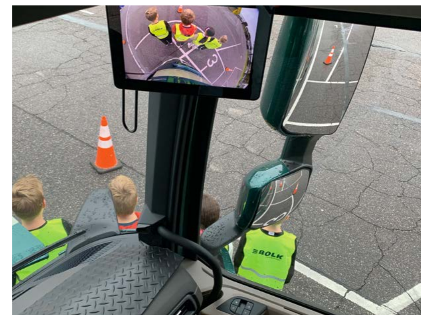
LEER OVER DE DODE HOEK

niet eens begonnen en ik vind het nu al helemaal leuk'. Wie weet is zij – én met haar nog veel meer leerlingen – geïnspireerd voor een toekomst in de techniek.