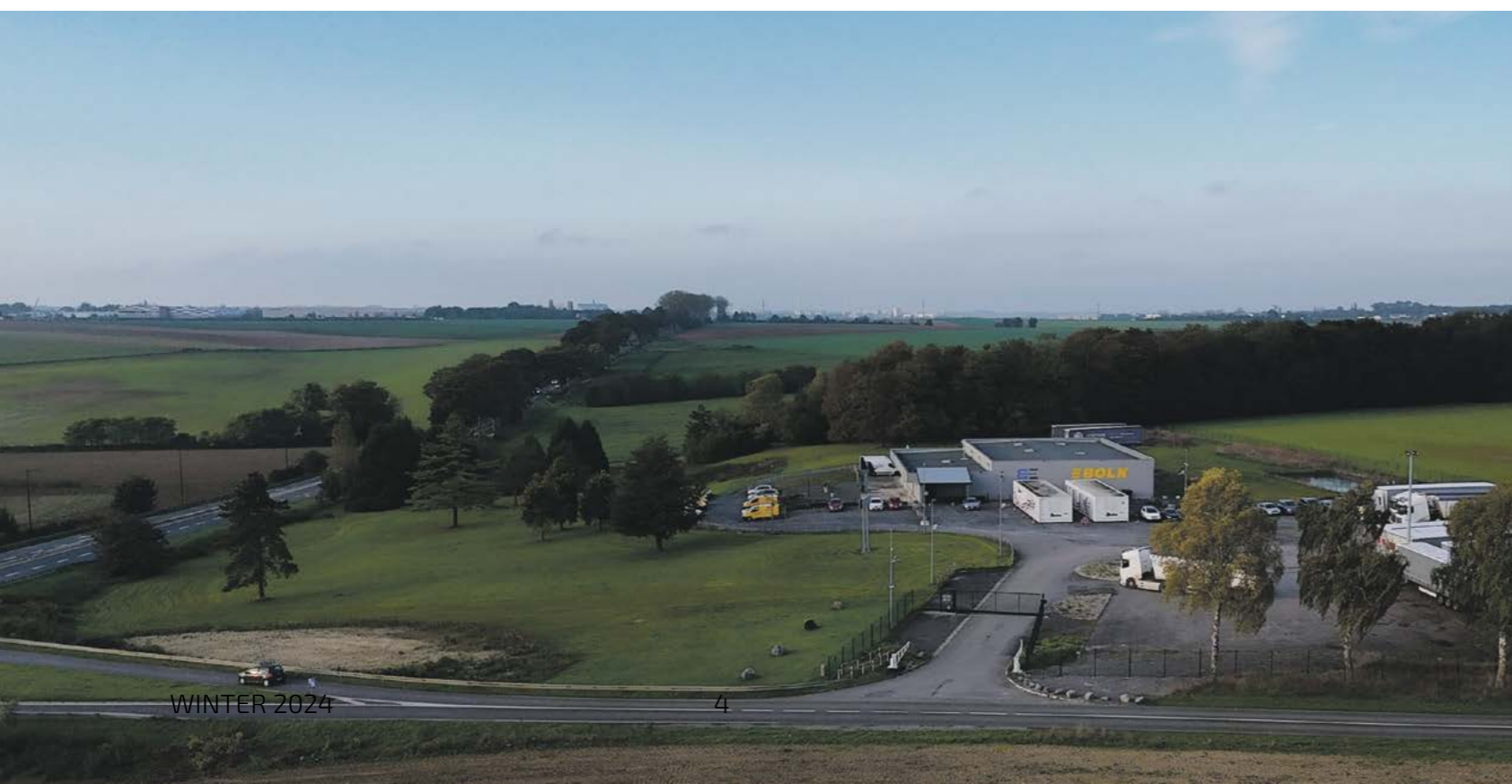
DE D1044 IS EEN DOORGAANDE ROUTE VOOR UITZONDERLIJKE TRANSPORTEN